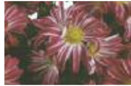
Funk violet et blanc