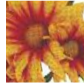
Rap jaune & rouge