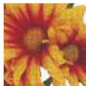
Rap jaune & rouge