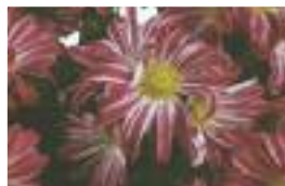
Funk violet et blanc