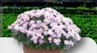
JARDINIÈRE 40 cm de long